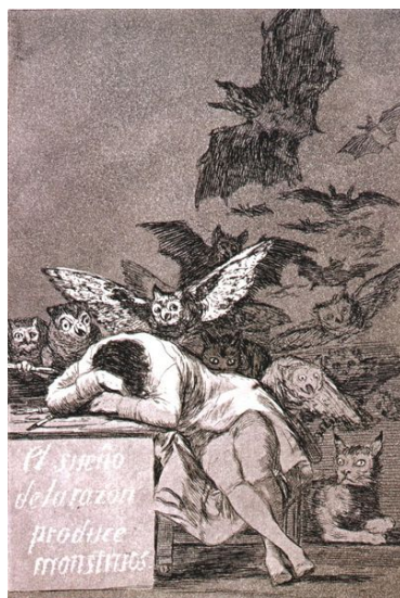
Francisco de Goya y Lucientes, El sueño de la razón produce monstruos , 1793 15

En El ocaso de la Edad Moderna Guardini propuso para el tipo humano que hoy se está desarrollando –“como efecto y como presupuesto a la vez de este proceso”- el concepto de hombre no humano . Ese concepto es retomado en El poder donde señala que el crecimiento de la eficiencia y dominio, “significa también una creciente incapacidad de sentir, una frialdad de corazón cada vez mayor, una indiferencia con respecto al hombre y a las cosas de la vida.” 14 La mediatización de la técnica en la percepción hace peligrar el ejercicio de las dimensiones de conocimiento, amor y creación plenamente humanas.